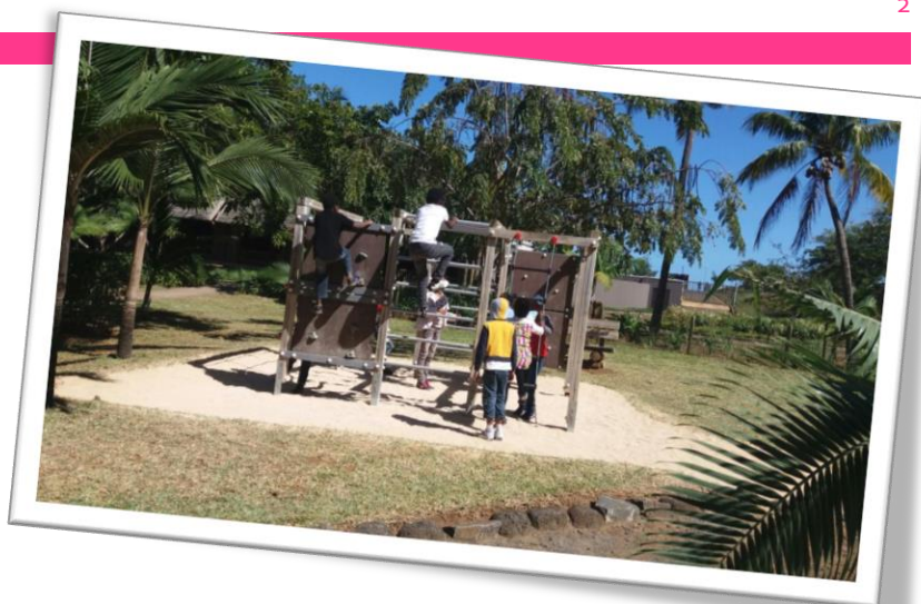
Sortie pédagogique au Casela